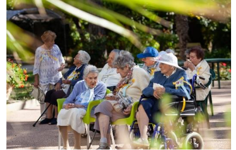
Petites Sœurs des Pauvres

Un fait encourageant nous a été récemment partagé par « Ma Maison » de Nantes : « Une personne âgée de la maison est venue trouver la Mère supérieure : « Ma Mère, nous devons proclamer Jésus Christ. Pouvons-nous, en plus de la pastorale avec l'aumônier, avoir des rencontres avec ceux qui ne croient pas beaucoup et qui ne viennent jamais à la messe ou peu ? Au moins 1 ou 2 fois par semaine, même si ce n'est que pour 15 minutes, pour partager notre foi avec eux, s'ils sont d'accord ? » Dès la semaine suivante, une Petite Sœur et la résidente s'occupent de ces rencontres ; les résidents en sont très heureux et y viennent avec beaucoup de joie. Disons – ajoute le récit avec un peu d'humour –, que ces rencontres ne sont pas longues et qu'il y a toujours un bon goûter à la fin qui réjouit tout le monde ! Mais, en attendant, la parole de Dieu est proclamée... »